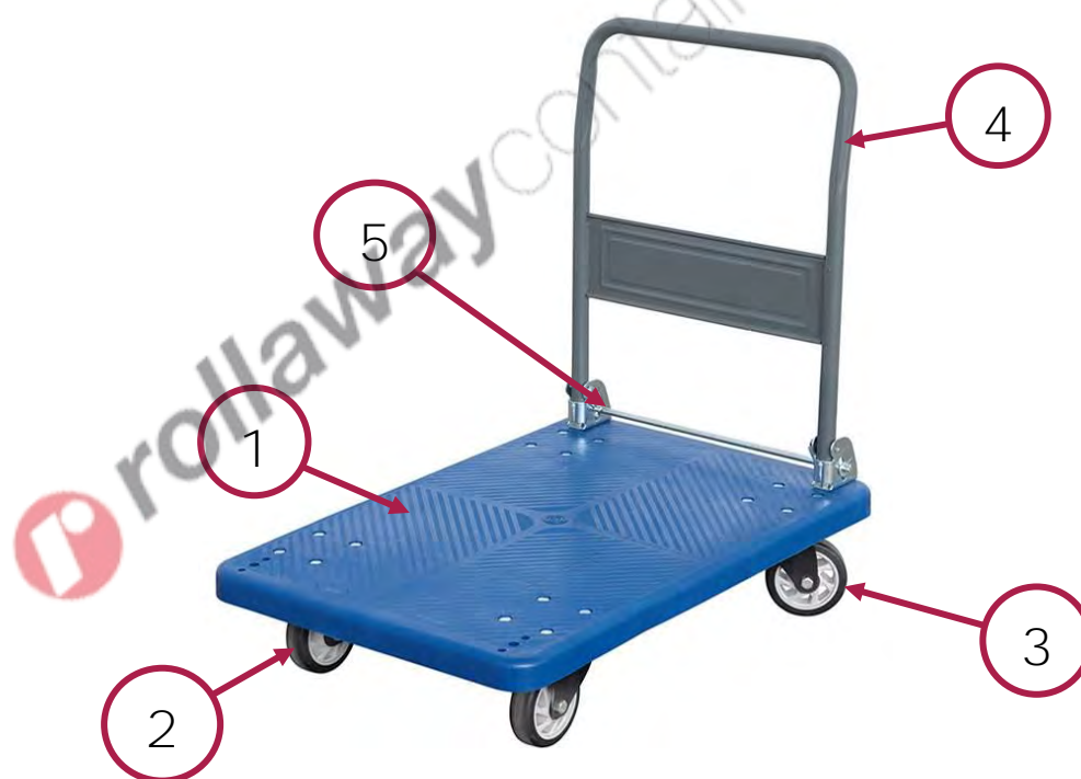
Figura 1 – Vista generale del carrello.

Altri tipi di impiego, oppure l'ampliamento dell'impiego oltre quello previsto, non corrispondono alla destinazione attribuita dal costruttore, e pertanto lo stesso non può assumersi alcuna responsabilità per danni eventualmente risultanti.