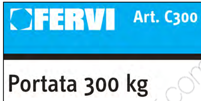
Figura 2 – Dettaglio targhetta

La targa d'identificazione è applicata al telaio (vedere la figura 2).