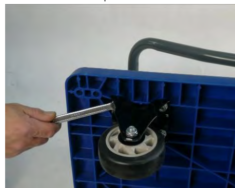
Figura 5 - Inserimento viti di fissaggio