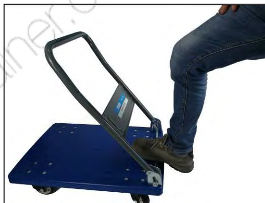
Figura 6 - Ripiegare il timone

Per ripiegare il timone premere con il piede la barra posta nella parte bassa del timone e spingere in avanti lo stesso fino ad adagiarlo sulla piattaforma del carrello.