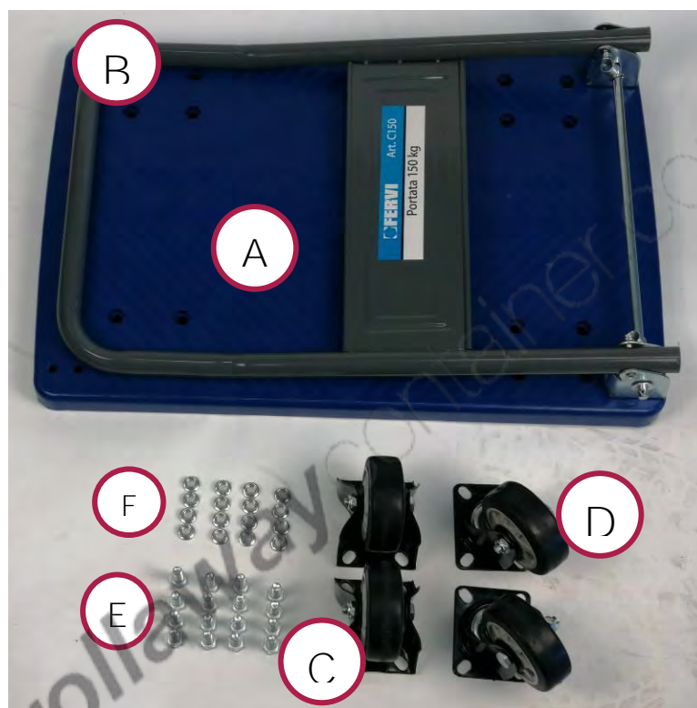
Figura 3 – Parti del carrello smontate.

Il Carrello viene fornito in una scatola di cartone, con le ruote smontate (vedere la figura 3). Prima di eliminare il cartone di imballaggio, controllare di non gettare parti del carrello (ad esempio le viti di fissaggio delle ruote), il manuale di istruzioni o altra documentazione.