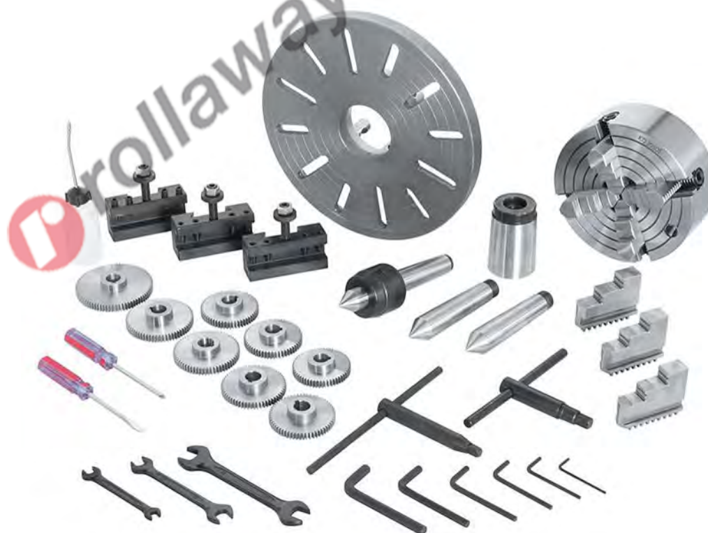
Figura 48 – Accessori forniti con il tornio T070/400V3A.